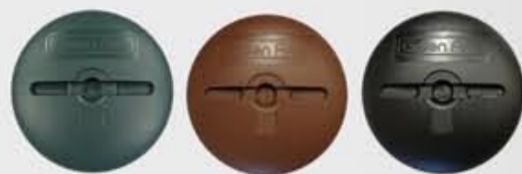
GAロゴ入りワッシャー