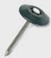
コンクリート釘 + ミニワッシャー