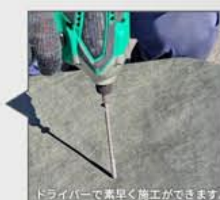
ドライバで早く施工ができます。