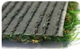
他社人工芝 裏 3層バックング