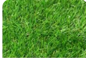
他社人工芝 パイル 極細パイル