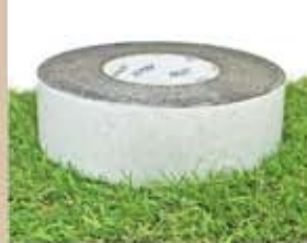
GAS人工芝用 両面テープ