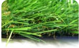
他社人工芝 目付数 約40万本/m 2