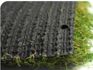
ターフグランデ 裏 端部まで分厚い 4 層バックング