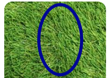
ターフグランデ 継ぎ目が 目立たない