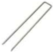
GAW コ型ピン 150mm 200mm 300mm